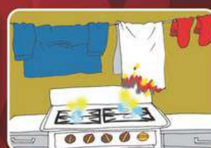
Сушка белья над газовой плитой