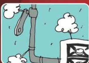
Утечка и взрыв бытового газа