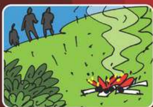
Неосторожное обращение с огнём