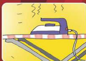
Оставленные без присмотра работающие электрические приборы