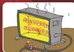
Использование неисправных или самодельных бытовых и отопительных приборов