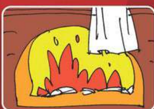
Незакрытые дверцы печей и топок