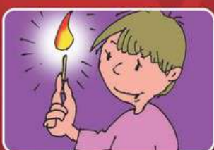
Шалости детей с огнём